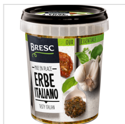
Bresc Italiaanse kruiden 450g