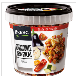
Bresc Ratatouille 1000g