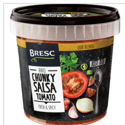
Bresc Salsa met grove tomatenstukjes 1000g