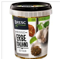
Bresc Italiaanse kruiden 450g