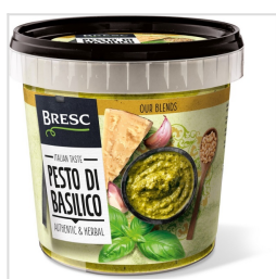
Bresc Pesto van basilicum 1000g