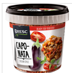
Bresc Caponata 1000g