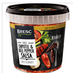
Bresc Salsa aux Chipotle et Poivrons 1000g