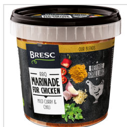
Bresc Marinade pour poulet 1000g