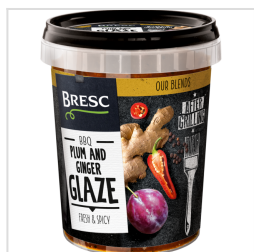
Bresc Glaçage prunes et gingembre 450g