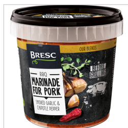
Marinade pour viande de porc 1000g