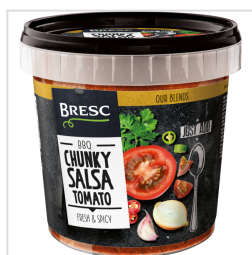
Salsa avec de gros morceaux de tomate 1000g