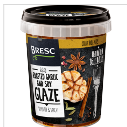
Glaçage ail rôti et soja 450g