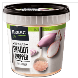
Bresc Échalote hachée 1000g